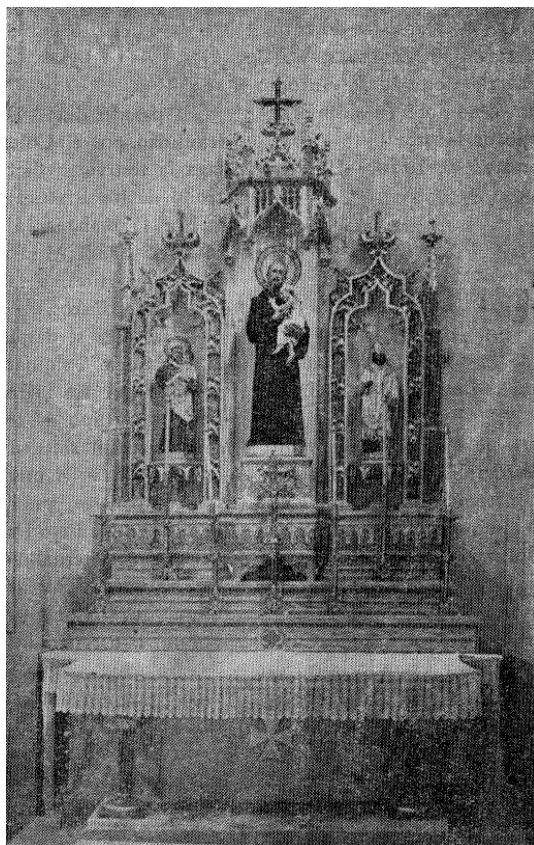
Figura 2. Altar levantado en la Capilla de la Clínica Provincial de Huesca por los Practicantes españoles en honor a su Patrón San Juan de Dios.