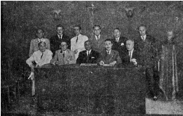
Figura 3. Los miembros del Colegio de Practicantes de Granada y las diferentes comisiones organizadoras de los Actos del IV Centenario de la muerte de San Juan de Dios.

Los Actos Conmemorativos del IV Centenario de la muerte de San Juan de Dios que organizó el Ilustre Colegio de Practicantes de Granada tuvieron lugar del 31 de mayo al 5 de junio de 1950 8 (figura 3). Asistieron representantes de casi todos los Colegios de Practicantes de España, así como practicantes de diversos puntos de la geografía.