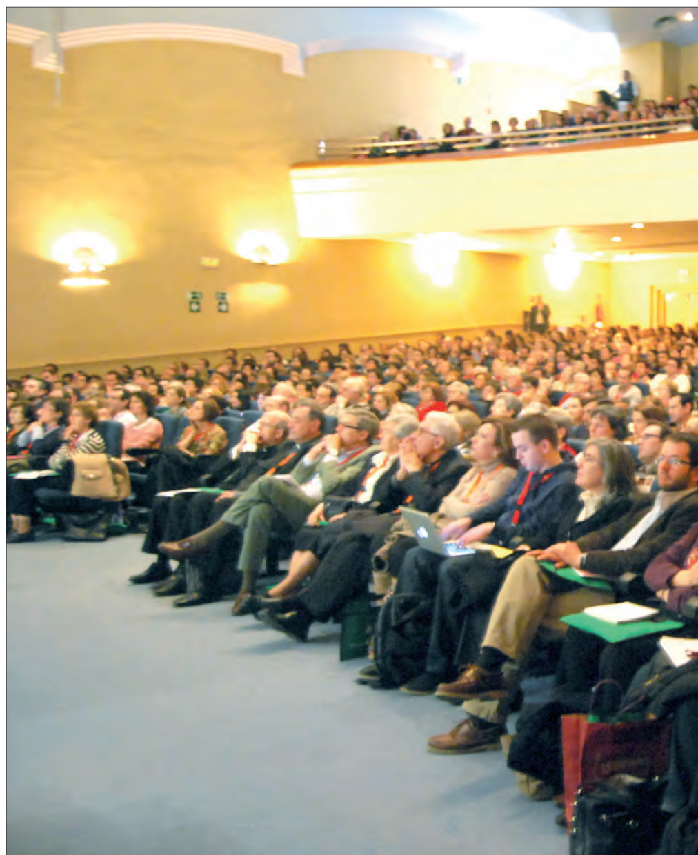
Un millar de laicos participó ayer en el I Encuentro de Misión Compartida, celebrado en el Colegio Nuestra