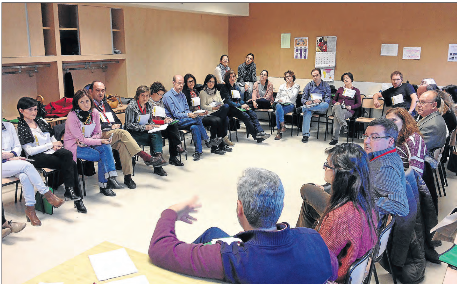
El taller 'Laicos y el compromiso social: trabajando en la construcción del Reino' tuvo una excepcional acogida entre los asistentes. / IRENE GUTIÉRREZ