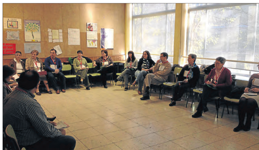
Los participantes en el taller 'Vivir y avanzar en la misión compartida'.

Entre los asistentes se encontraban cuatro religiosas que explicaron también que los religiosos tienen un compromiso muy fuerte en el trabajo de misión compartida. Si bien, el latir general de los presentes tras la sesión fue que aún está por diseñar el verdadero sitio de los laicos a nivel organizativo.