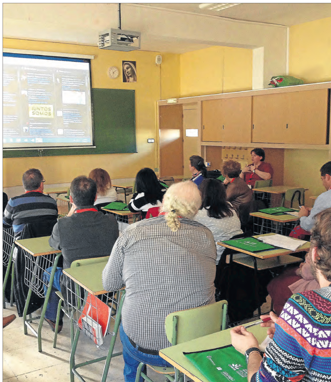
Un grupo de laicos atiende las explicaciones sobre la importancia de las redes sociales.

En el segundo punto del decálogo y en relación con la película de La Misión que decíamos antes, se aclara que Internet es el lugar y no el medio ni el instrumento. Por lo tanto, se trata de evangeli-